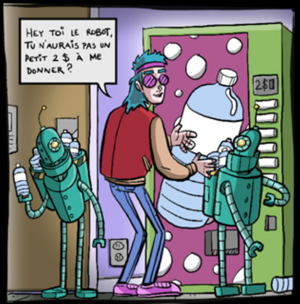
HEY TOI LE ROBOT, TU N'AURAS PAS UN PETIT 2 $ À ME DONNER ?