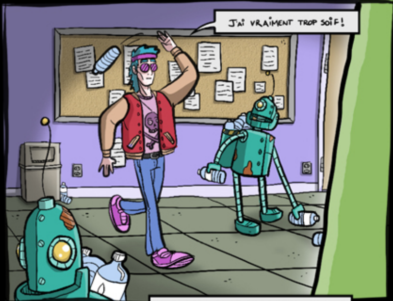
J'AI VRAIMENT TROP SOIF!