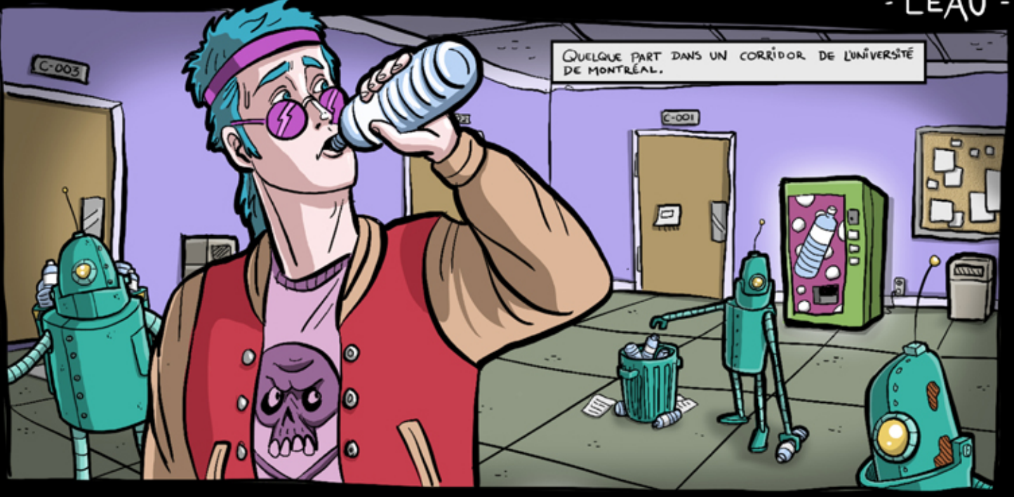
QUELQUE PART DANS UN CORRIDOR DE L'UNIVERSITÉ DE MONTRÉAL.