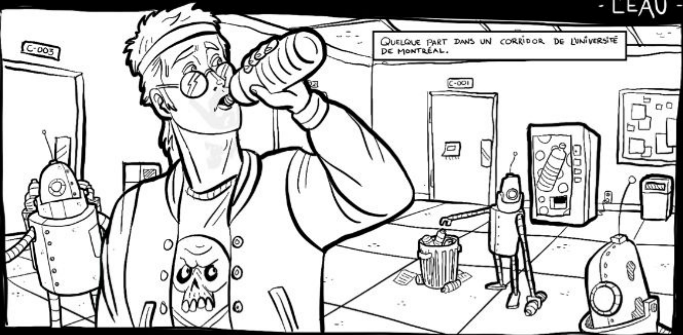
QUELQUE PART DANS UN CORRIDOR DE L'UNIVERSITÉ DE MONTRÉAL.