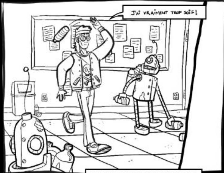
J'AI VRAIMENT TROP SOIF!